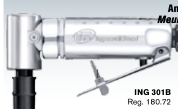
Angle Die Grinder Meuleuse angulaire