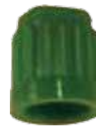
Tire Cap Capuchon de valves