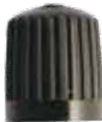
Tire Cap Capuchon de valves