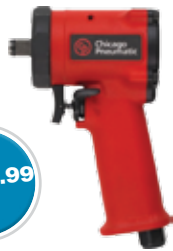
Impact Wrench Clé à chocs

1/2" Stubby/Courte 690 CP732 Reg. 293.04