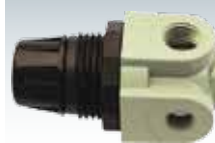
Mini Regulator, Lubricator Mini-régulateur, Lubrificateur NPT