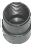
Lug Nut Remover Outil pour enlever les écrous de roues