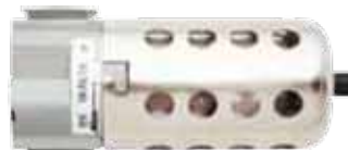
Filter NPT Filtre NPT

1/4", 3/8", 1/2" 507 1018, 1019, 1020 Reg. 95.53-97.87