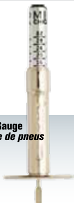
Tread Depth Gauge Jauge d'usure de pneus