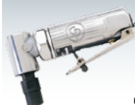
Mini Angle Grinder Mini-meuleuse angulaire