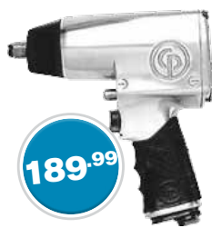
Impact Wrench Clé à chocs

1/2" Super Heavy Duty Usage très intensif 690 CP734H Reg. 360.74