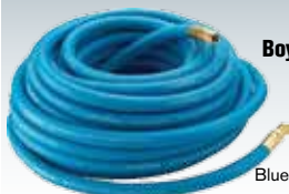
Air Hose Boyau d'air

Blue/bleu, EPDM 3/8" x 25' GYR 65133 $36.49 3/8" x 50' GYR 65137 $59.69