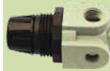
Mini Regulator, Lubricator Mini-régulateur, Lubrificateur NPT