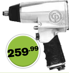
Impact Wrench Clé à chocs

1/2" Super Heavy Duty Usage très intensif 690 CP734H Reg. 360.74