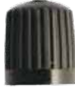
Tire Cap Capuchon de valves