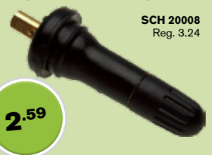
Snap In Valve System Système de valves à pression