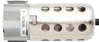
Filter NPT Filtre NPT

507 1018 $66.49 1/4" 507 1019 $66.49 3/8" 507 1020 $68.09 1/2"