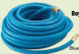
Air Hose Boyau d'air

Blue/bleu, EPDM 3/8" x 25' GYR 65133 $36.49 3/8" x 50' GYR 65137 $59.69