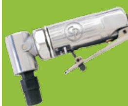
Mini Angle Grinder Mini-meuleuse angulaire