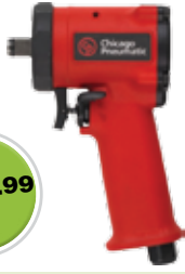
Impact Wrench Clé à chocs

1/2" Stubby/Courte 690 CP732 Reg. 293.04