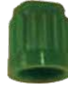
Tire Cap Capuchon de valves